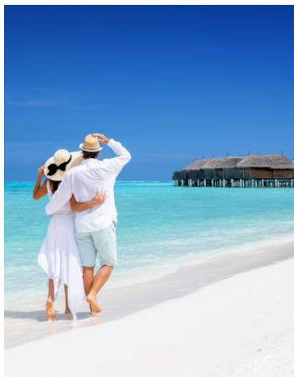
ATLASZ Fakultatív Útlemondás