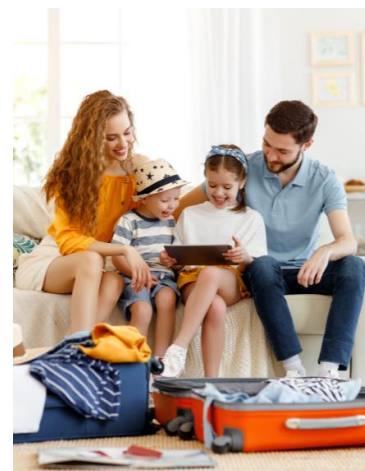
ATLASZ Menetjegy Biztosítás